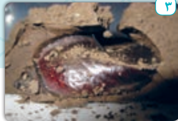
٣- الْجَافُ: خَشَكٌ